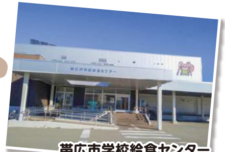
帯広市学校給食センター 帯広市南町南8線42番地3 電話:0155-49-1900