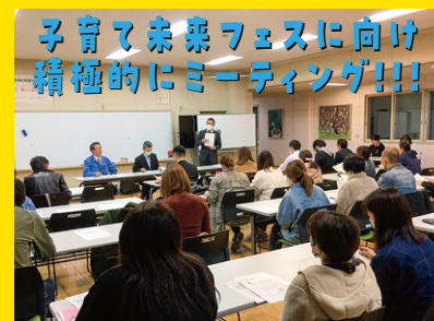
子育て未来フェスに向け積極的にミーティング!!!