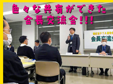
色々な共有ができた会長交流会!!!