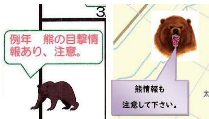
▲広野小学校・八千代中学校(左)と清川地区地域(右)の安全マップ

矢野: 帯広市 PTA 連合会のHPには各学校の安全マップが掲載されているので、ぜひ確認してみてくださいね!