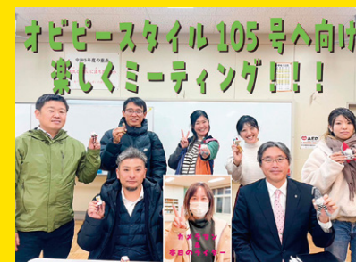
OBI-Pスタイル105号へ向け楽しくミーティング!!!